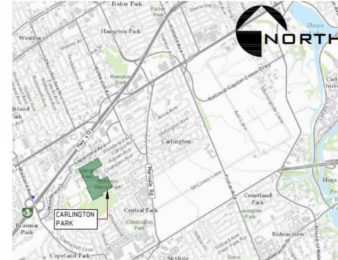
Carlington Site – Location Plan / Site Carlington – plan de localisation