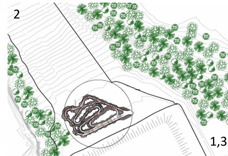
Approximate Project Site with Access Points / Site approximatif du projet avec points d'accès